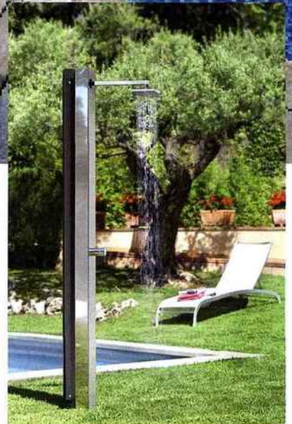
▲ Le modèle Niagara est une douche d'extérieur. De style épuré, elle offre des lignes contemporaines. Fabriquée avec des matériaux de première qualité, elle assure un fonctionnement optimal au bord de votre piscine. AstralPool, douche Niagara, www.astralpool.com .

Un esprit contemporain pour cette grande piscine à débordement de 15 x 4 m, à fond plat (1,57 m), réalisée en blocs à bancher. L'escalier-banquette conçu dans l'angle du bassin permet d'allier à la fois la convivialité et le bien-être lorsque les 4 buses de massage qui y sont intégrées sont en fonctionnement. Carré Bleu, Pyrénées Atlantiques.