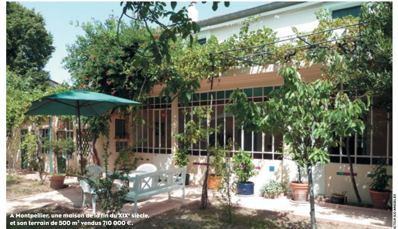
À Montpellier, une maison de la fin du XIX e siècle, et son terrain de 500 m 2 vendus 710 000 €.