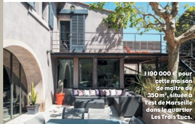
1 190 000 € pour cette maison de maître de 350 m 2 , située à l'est de Marseille dans le quartier Les Trois Lucs.